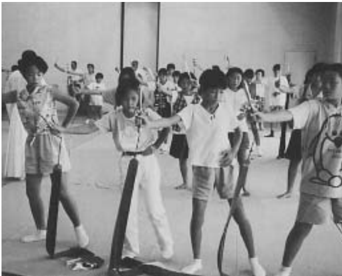
高梁上房支部の浦安の舞研修会

● 神社実務研修会 ―十一月二十二日、岡山市東山、玉井宮東照宮参集所。講師・高原家康先生、受講者四十一名。